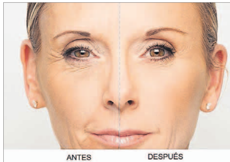
Aspecto más joven y natural tras tratamiento con ácido hialurónico.

gún el Dr. Velázquez Villoria, puede aplicarse entre una y tres veces al año, y sus beneficios permanecen en la piel hasta 12 o 18 meses según el área tratada y el producto utilizado. "Por norma general en la primera visita necesitaremos más cantidad de producto al encontrarnos con mayor pérdida de volumen de colágeno", explica el doctor. Esta pérdida de volúmenes origina la caída de las estructuras faciales provocando que tengamos una cara avejentada o de cansancio constante. Gracias a la reposición de esp-